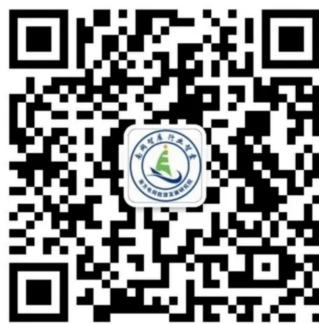
南网能源院公众号

（三）若出现疫情等不可抗力影响，线下宣讲、面试将转为线上方式进行。请关注“南网能源院”公众号，招聘信息将在公众号中实时推送。